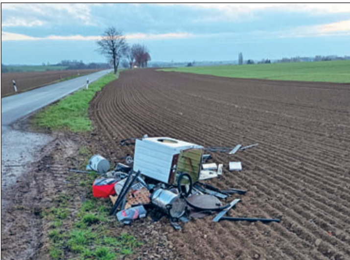
Aufnahme vom 16.03.2026 zwischen Pinnewitz und Leippen

Wir bedanken uns für Ihre Mithilfe, die Umwelt sauber zu halten.