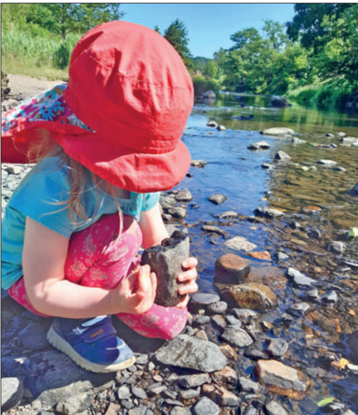
Bei einem genauen Blick ins Gewässer, kann man vieles entdecken.

Dieser Text entstand in Zusammenarbeit der Fachberaterinnen und Fachberater Gewässer des Landesamtes für Umwelt, Landwirtschaft und Geologie und der unteren Wasserbehörde des Landkreises.